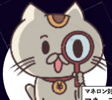
マネロン対策キャラクター マネっちゃん

金融機関をご利用のお客さまお一人お一人の情報を確認することで 犯罪収益の移転やテロ資金供与を、防止することができます